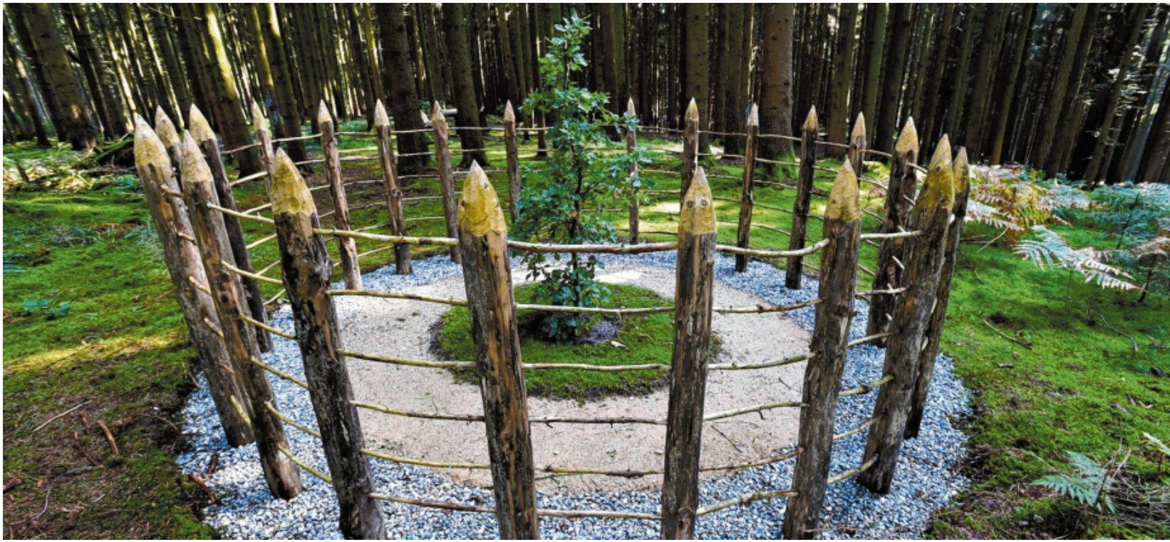
Seit sechs Jahren gibt es den LandArt-Kunstpfad in Bonstetten. Er wurde vom Fischacher Künstler Hama Lohrmann in Zusammenarbeit mit einigen regionalen Institutionen errichtet. Nun wurde die Ausstellung um eine Audiofunktion erweitert. Hier zu sehen: Die vorletzte Kunststation auf dem Weg durch die Wälder.