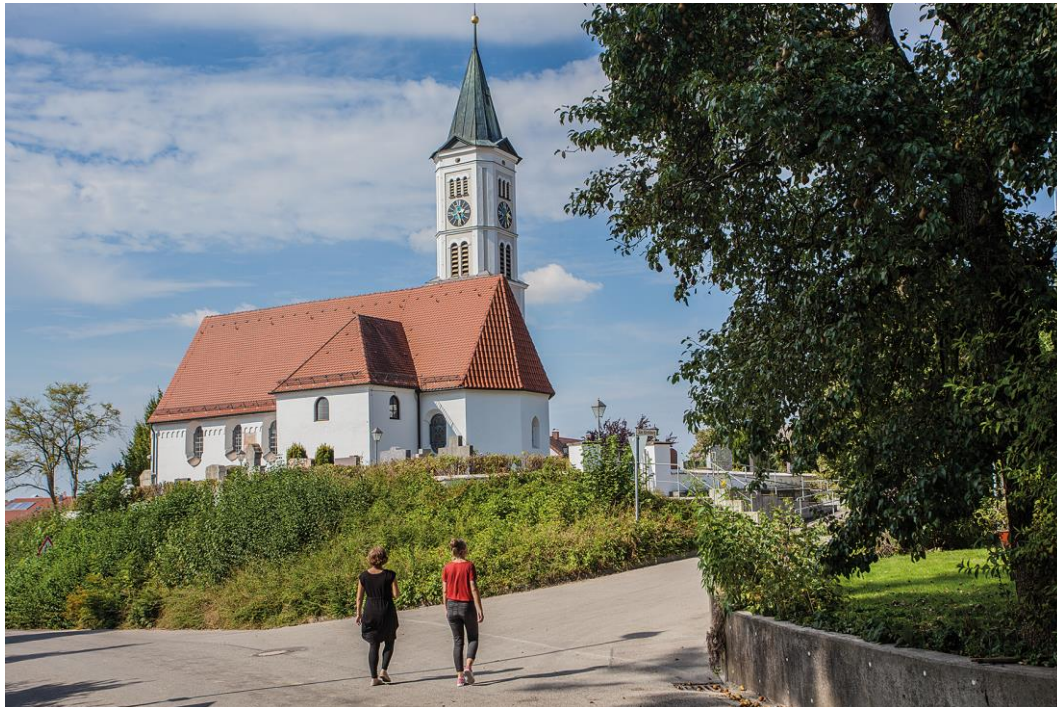
Bild 1: Bei einer Wanderung im „Wittelsbacher Land“ kommt man an der Kirche St. Johannes Baptist in Meringerzell vorbei. Das Innere des Sakralbaus birgt eine spektakuläre gotische Wandmalerei. Der weitere Weg führt zu den Relikten zweier Ungarnschutzburgen im Meringer Hartwald.

Telefon: 0821 50207-30, E-Mail: regio@regio-augsburg.de