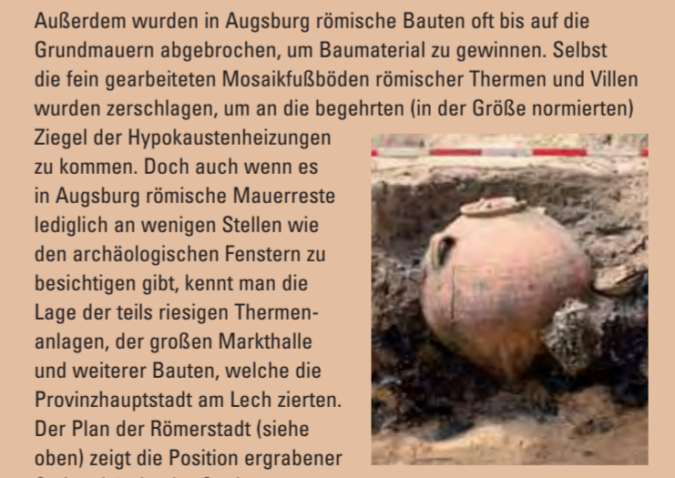
Römische Urnenbestattung aus dem Gräberfeld bei der heutigen Augsburger Diakonissenanstalt.

Außerdem wurden in Augsburg römische Bauten oft bis auf die Grundmauern abgebrochen, um Baumaterial zu gewinnen. Selbst die fein gearbeiteten Mosaikfußböden römischer Thermen und Villen wurden zerschlagen, um an die begehrten (in der Größe normierten) Ziegel der Hypokaustenheizungen zu kommen. Doch auch wenn es in Augsburg römische Mauerreste lediglich an wenigen Stellen wie den archäologischen Fenstern zu besichtigen gibt, kennt man die Lage der teils riesigen Thermenanlagen, der großen Markthalle und weiterer Bauten, welche die Provinzhauptstadt am Lech zierten. Der Plan der Römerstadt (siehe oben) zeigt die Position ergrabener Steingebäude, der Stadtmauer und ihrer Tore.