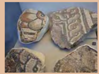
Mosaikfragmente aus dem römischen Augsburg: Um an die Ziegelsteine der Hypokaustenheizung zu kommen, zerstörten spätere Stadtbewohner kunstvoll verlegte Mosaikfußböden.

längste Tradition zurückblickt, im Zentrum des Interesses. Obwohl die ehemalige Provinzhauptstadt Augsburg zu den am längsten besiedelten Plätzen der Römerzeit in Deutschland gehört, gibt es im öffentlichen Straßenraum kaum römische Relikte zu sehen. Das liegt daran, dass die meisten Römerbauten bis zu sieben Meter tief unter der mittelalterlichen und neuzeitlichen Bebauung verschwunden sind. Die Überbauung erschwert die Ausgrabungstätigkeit der Stadtarchäologie. Ähnlich wie in den Römerstädten Regensburg und Kempten, aber auch in Trier, Köln oder Mainz, ist eine systematische Grabungsarbeit deshalb kaum möglich.