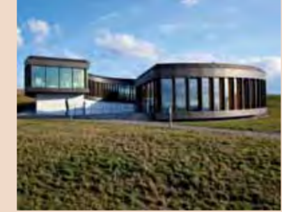
Zentrum des Römerparks in Ruffenhofen ist der spektakuläre Museumsneubau.

2012 wurde das LIMESEUM – ein Museum zum Welterbe Limes in Ruffenhofen (Landkreis Ansbach) – eröffnet. Das Zentrum des Römerparks ist der runde Museumsneubau. Seine futuristische Glasfassade ermöglicht es Besuchern, beim Gang durch die Dauerausstellung das umliegende Welterbeareal mit dem Kastell im Römerpark im Blick zu behalten. Das Museum widmet sich multimedial dem Abschnitt des Limes bei Ruffenhofen. Zentrale Themen sind das Leben römischer Soldaten am Grenzwall und der Zivilbevölkerung im Lagerdorf.