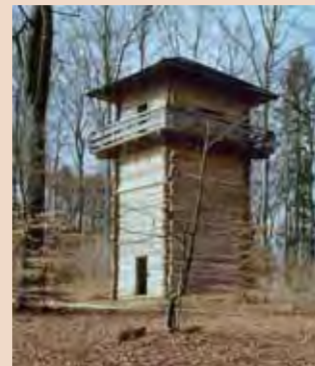
Der Limes-Wanderweg führt zu rekonstruierten Wachtürmen wie dem bei Kiptenberg im oberbayerischen Landkreis Eichstätt.

Die 700 Kilometer lange Deutsche Limes-Straße ist eine Tourismusroute entlang dieses Grenzwalls. In Bayern leitet die Deutsche Limes-Straße von Aschaffenburg am Main bis nach Regensburg an der Donau. Von Augsburg aus erreicht man die Deutsche Limes-Straße mit dem Auto über die Bundesstraße 2. www.limesstrasse.de