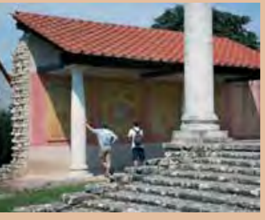
Der Apollo-Grannus-Tempel im Lauinger Stadtteil Faimingen wurde teilweise rekonstruiert.

Mehr zur Via Danubia: Regio Augsburg Tourismus Tourist-Info am Rathausplatz 86150 Augsburg Telefon 08 21/5 02 07-0 www.augsburg-tourismus.de