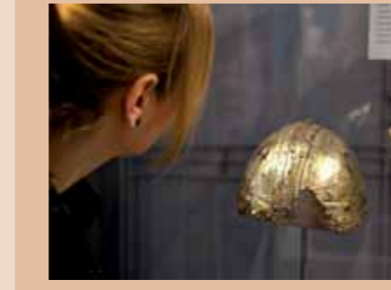
In der Augsburger Innenstadt steht die Römerstadt, deren archäologische Erforschung zudem auf die Der vergoldete Offiziershelm in der Römerausstellung im Zeughaus Augsburg war eine der spektakulärsten Funde im heutigen Stadtgebiet.

Zur Sicherung unersetzlicher Bodendenkmäler unterhält die Stadt Augsburg seit 1978 die Stadtarchäologie, die damals als eine Abteilung des Römischen Museums der städtischen Kunstsammlungen eingerichtet wurde. Eine der Hauptaufgaben der Stadtarchäologie ist die Pflege der Bodendenkmäler im Stadtgebiet. Sie setzt sich daher nach Möglichkeit für den Erhalt der Denkmalsubstanz ein. Wo dies nicht möglich ist, bereitet die Stadtarchäologie Ausgrabungen vor und führt sie durch. Da eine solche Ausgrabung gleichzeitig der unumkehrbare Prozess einer kontrollierten Zerstörung von Denkmälern ist, kommt den Ausgräbern eine besonders große Verantwortung zu, die Zeugnisse der Vergangenheit für künftige Generationen zu dokumentieren und zu sichern. Mit einem Team von zwölf Mitarbeitern führt die Stadtarchäologie innerhalb des Stadtgebiets Ausgrabungen durch, die von nur mehrtägigen Baubeobachtungen bis hin zu mehrjährigen Großprojekten reichen können.