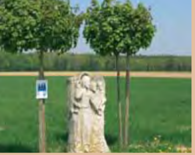
An der Via Julia zwischen Glöttweg und Röfingen im Landkreis Günzburg.

Mehr zur Via Julia: Regio Augsburg Tourismus Tourist-Info am Rathausplatz 86150 Augsburg Telefon 08 21/5 02 07-0 www.augsburg-tourismus.de