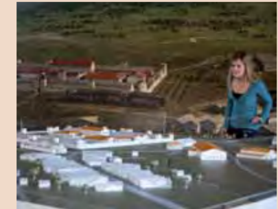
Die Dauerausstellung im LIMESEUM zeigt ein Modell des römischen Reiterkastells.

Das Gelände des Römerparks Ruffenhofen war bis 2003 eine Ackerfläche. Darunter lag eines der bedeutendsten Bodendenkmäler am Limes in Bayern – die Relikte eines Reiterkastells und der dazugehörigen Zivilsiedlung. Um die Fundamente zu bewahren, hat man die bis dahin umgepflügten Flächen angekauft und in Wiesen umgewandelt. Im Römerpark wurden die Strukturen der römischen Bebauung durch die Bepflanzung dieses Areals markiert und visualisiert. Am Fuße des Aussichtshügels wurde das einstige Reiterkastell am Limes im Maßstab 1:10 nachgebaut. Beschreibungen, großformatige Illustrationen sowie Abgüsse römischer Steindenkmäler informieren im Gelände zu Bauten und zum Alltag der Römer. Von dort lohnt sich ein Abstecher auf den nahen Hesselberg hoch über dem Wörnitztal.