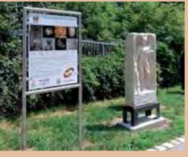
Tabeln in der archäologischen Nische am Augsburger Predigerberg informieren auch zur Via Claudia Augusta.

Via Claudia Info A-6521 Fieß, 89 Telefon +43 (0) 6 64/27 63-5 55 info@viac Claudia.de www.viac Claudia.de