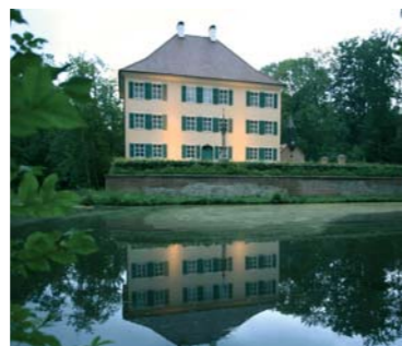
Im Sisi-Schloss in Unterwittelsbach verbrachte die spätere Kaiserin Elisabeth stille Kindheitstage. Das Schloss Neuschwanstein im Allgäu ist nur eine Autostunde entfernt.

In dieser reizvollen altpaläontologischen Landschaft erinnern gleich drei Schlösser an den Vater und die Kindheit der Wittelsbacherin Elisabeth, die