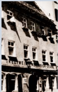
Bertolt Brecht als Gipsfigur empfängt in „Brechts Bistro“ (links). „Gablers Taverne“ war seine Stammkneipe (oben).