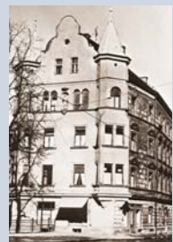
Die Gedenktafel am Haus „Bei den sieben Kindeln 1“ erinnert an das zweite Elternhaus Bert Brechts.