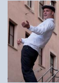
Bertolt Brecht – verkörpert durch einen Schauspieler – führt durch seine Heimatstadt.

Treffen Sie den berühmten Dichter und Dramatiker persönlich! Eine Gästeführerin zeigt Ihnen sein Geburtshaus, die wechselnden Wohnhäuser seiner Familie sowie seine Lieblingsplätze in der Altstadt – an mehreren Stationen begegnen Sie dabei Bert Brecht selbst (verkörpert durch einen Schauspieler).