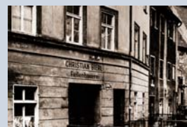
Im Brechthaus wurde Bertolt Brecht 1898 geboren. Die 1985 gegründete Gedenkstätte wurde 1998 ausgebaut.