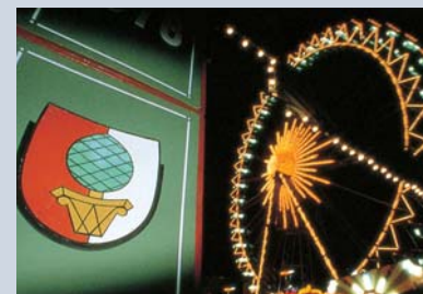
Brecht liebte die Volksfeste. Den Augsburger Plärrer hat er literarisch verewigt.

„Immer streune ich abends üben Plärrer... und fahre mit der Schiffschaukel“, schrieb Brecht 1920 in sein Tagebuch. Er war von dem Traditionsvolksfest und vor allem von den immer wieder erwähnten Schiffschaukeln begeistert. Ein Zeitgenosse berichtet: „Brecht war regelmäßig mit Frauen auf dem Plärrer. ‚Dort lernt man die Welt kennen, wie sie wirklich ist‘, sagte er mir einmal“. Und weiter: „Diese Welt gab Brecht sehr viel. Er liebte die Volksfeste. Wir besuchten nicht nur den Plärrer. Da gab es alljährlich noch das Friedberger Volksfest, die Lechhauser Kirchweih und im August alljährlich die Jakober-Kirchweih...“. Der Plärrer, das größte Volksfest Schwabens, findet heute zweimal jährlich – jeweils an Ostern und im Spätsommer – statt. Und auch die anderen von Brecht besuchten Volksfeste gibt es nach wie vor.