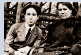
Das Grab der Eltern Brechts (links). Der aufstrebende Literat mit seiner Mutter (oben).