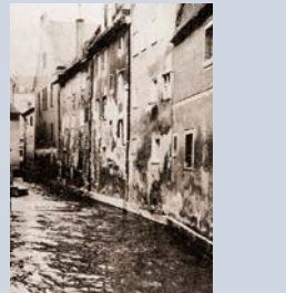
Vor und hinter dem schmalen Geburtshaus Bertolt Brechts fließt noch heute ein Lechkanal vorbei.