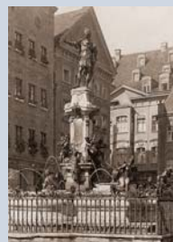
Blick auf den Perlach und das Renaissance-rathaus. Auf dem Rathausplatz steht seit dem Jahr 1594 der Augustusbrunnen.