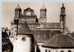
So sah Brecht das Rathaus und den Perlachturm. Im Rathaus sieht man den Goldenen Saal.

1940 schrieb Bert Brecht die Erzählung „Der Augsburger Kreidekreis“. Schauplatz eines salomonischen Urteils, bei dem der weise Richter ein Kind der falschen, aber liebenden (Zieh-)Mutter zuspricht, ist der prächtige Goldene Saal des Augsburger Rathauses. 1995 wurde im Goldenen Saal (ein atemberaubend schöner frühbarocker Prunksaal) erstmalig der alle drei Jahre vergebene Bert-Brecht-Preis der Stadt Augsburg überreicht. Das von den Brecht-Brüdern häufig bestaunte mächtige Augsburger Rathaus, 1616 bis 1620 von Stadtbaumeister Elias Holl errichtet, gilt als einer der wichtigsten Profanbauten der deutschen Renaissance. Der Goldene Saal im Rathaus kann täglich von 10 bis 18 Uhr besichtigt werden.