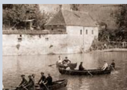
Die Kahnfahrt gegenüber der Bert-Brecht-Straße heute und auf einem Foto aus der Zeit der Kindheit Bertolt Brechts.