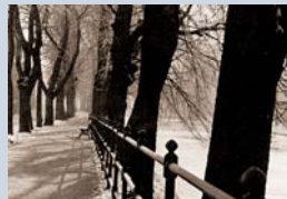
Der Fünfgratturm gefiel schon dem jungen Bert Brecht. Der Weg dorthin führt durch die Kastanienallee, der er ein literarisches Denkmal setzte.