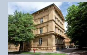
Brechts zweite Schule, die heutige St.-Anna-Schule an der Schaezlerstraße.

Brecht rund ums Rathaus: Brechts Geburtshaus/Gedenkstätte – Barfüßerkirche – Handwerkeraltstadt (Mittlerer Lech – Bauerntanzgässchen – Vorderer Lech – Weiße Gasse – Judenberg) – Rathausplatz – Rathaus – Goldener Saal – Perlach (Dauer: ca. 45 Gehminuten zuzüglich Aufenthalt im Brechthaus)