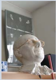
Der weltweit einzigartige Brecht-Shop in der Buchhandlung am Obstmarkt.