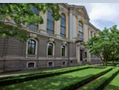
Die Staats- und Stadtbibliothek Augsburg informiert zu Leben und Werk Bertolt Brechts.

Barfüßern (1944 zerstört), in der dritten und vierten Klasse in der heutigen St.-Anna-Schule (Schaezlerstraße), neun Jahre am Realgymnasium an der Blauen Kappe (das heutige Peutingergymnasium). Augsburg hat Brecht wie keine zweite Stadt geprägt.