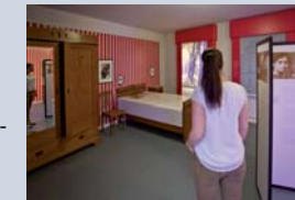
Wissenswertes zu Bertolt Brecht, seiner Augsburger Kindheit und Jugend und zu seinem bewegten Leben erfahren Besucher des Museums im Brechthaus.

Bertolt Brecht schrieb die „Dreigroschenoper“ und schuf die „Mutter Courage“. Der gebürtige Augsburger verbrachte seine Kindheits- und Jugendjahre am Lech. Wir zeigen Ihnen bei einem Spaziergang auf den Spuren des Dichters gerne mehr von Brechts Sicht auf seine Heimatstadt.