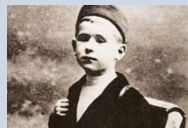
In der Barfüßerkirche wurde Bertolt Brecht getauft. In der benachbarten Schule lernte er das Abc.