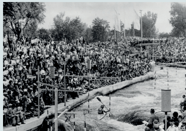
An den beiden Wettkampftagen im August 1972 tummelten sich jeweils mehr als 30.000 Personen an der neu gebauten Wildwasserstrecke.

Der Eiskanal – ursprünglich Ableitungskanal für das 1879 in Betrieb genommene Wasserwerk am Hochablass – sollte unter anderem die Turbinen von Treibeis freihalten: daher sein Name. Der Ausbau zur weltweit ersten künstlichen Wildwasser-Kanustrecke erfolgte für die Olympischen Sommerspiele von 1972 – Kanuslalom war 1972 erstmals olympische Disziplin. Das anspruchsvolle Bauvorhaben integrierte den alten Stadtbach und verwendete Sichtbeton als gestalterisches Element. Die „Mutter aller künstlichen Kanustrecken“ ist ein Beispiel modernster Stadtentwicklung in der zweiten Hälfte des 20. Jahrhunderts. Die in direkter Nachbarschaft zueinander liegenden UNESCO-Welterbe-Objekte Kanuslalomstrecke, historisches Wasserwerk und Hochablass bilden ein spannendes Ensemble im zentrumsnahen Naherholungsgebiet.