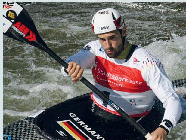
Der mehrfache Olympiamedaillengewinner und Weltmeister Hannes Aigner ist ein gebürtiger Augsburger – der Eiskanal ist seine Heimatstrecke.