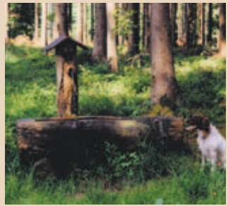
Die Ganghofer-Quelle bei Welden.

Die 1985 errichtete Hütte ist nach Ludwig Ganghofer benannt. Der gemütliche, jederzeit zugängliche Innenraum lädt zum Verweilen ein. Wandert man rund 400 Meter weiter auf dem Hörgrabenweg und folgt dem ersten links führenden Waldweg leicht bergauf, stößt man auf die August-Ganghofer-Hütte.