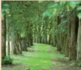
Die Lindenallee zur Theklakirche pflanzte Ludwig Ganghofers Vater.

Die Lindenallee auf dem Theklaberg wurde 1869 von Revierförster August Ganghofer gepflanzt. Ludwig Ganghofers Schwester vermerkte, dass „die Gemeinde die Pflanzen unent-