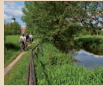
Das Geo-Portal für (Rad-)Wanderer listet vielfältige Routen in und um Augsburg auf.

Wandern und Radfahren in Augsburg und der Region – wer seine Zeit in der Natur gerne aktiv gestalten möchte, der sollte unbedingt einen Blick auf die interaktive Karte von Augsburg und Umgebung werfen. Hier kann man sich ganz einfach online informieren und zu einer Tour inspirieren lassen. In unserem Geoportal für (Rad-)Wanderungen finden sich zahlreiche Tourenvorschläge in und um Augsburg – kurze und längere, einfache und sportliche, für jeden Geschmack, jedes Wetter und jede Kondition. Alle Touren sind übersichtlich dargestellt, schnell und einfach auswählbar und enthalten detaillierte Beschreibungen. Genaue Angaben zu Distanzen und Höhenmetern ermöglichen die individuelle Gestaltung der Touren. Die GPX-Daten stehen zum Download bereit: www.augsburg-tourismus.de/de/radeln-und-wandern