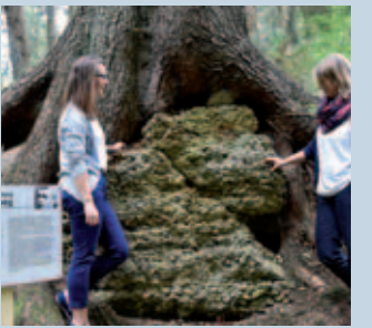
Am Rand des Lausbubenwegs: mächtige Bäume und ein riesiger Stein.

den Wald vom Aussichtsturm aus erforschen. Ganz nebenbei wird gewandert und man erfährt Wissenswertes über den Wald – und über die Kindheit Ludwig Ganghofers in Welden.