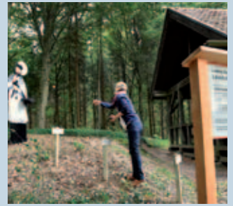
Tannenzapfenwerfen ins „Spatzennest“, das der Brückenheilige Nepomuk hält.

den Wald vom Aussichtsturm aus erforschen. Ganz nebenbei wird gewandert und man erfährt Wissenswertes über den Wald – und über die Kindheit Ludwig Ganghofers in Welden.