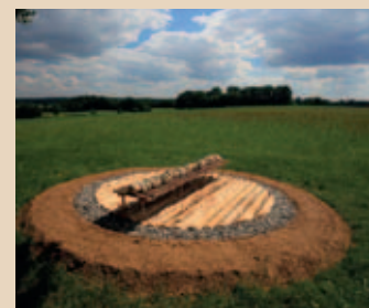
Der Kreis ist ein wiederkehrendes Motiv auf dem LandArt-Kunstpfads Bonstetten.

Weiterer Ausflugstipp ganz in der Nähe: Der LandArt-Kunstpfad Bonstetten: Für den LandArt-Kunstpfad Bonstetten hat Hama Lohrmann neun Kunstwerke entlang eines 5,6 Kilometer langen Rundwegs nahe der kleinen Gemeinde Bonstetten (nur etwa 5 Kilometer von Welden entfernt) geschaffen: Allein aus natürlichen Materialien und ohne technische Hilfsmittel sind so außergewöhnliche „Kraftorte“ entstanden. Der LandArt-Kunstpfad Bonstetten ist durchgehend beschildert, fahrrad- und kinderwagentauglich. Auch eine „Lauschtour“ ist verfügbar. Infos: www.augsburg-tourismus.de/de/landart