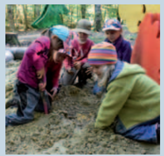
Hier macht man gerne halt, denn wer will nicht nach einem Schatz graben?

Auf dem „Ludwig Ganghofer Lausbubenweg“ kann man die Streiche des kleinen Ludwig Ganghofer nach erleben. Fünf Erlebnisstationen führen Familien zu Kapiteln in seinem Kindheits- und Jugendroman „Lebenslauf eines Optimisten“. Auf dem 3,5 km langen Rundkurs können kleine Waldentdecker im Sand nach einem Schatz graben oder hoch über dem Boden