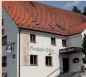
Der Landgasthof „Zum Hirsch“.

Erst nachdem die Mutter Ludwig Ganghofers aufgrund der schlechten Wohnbedingungen im alten Weldener Forsthaus an Typhus erkrankt war, ließ die Regierung 1865 das neue Forsthaus in der Bahnhofstraße 15 errichten. Das Forstamt Welden wurde 1973 aufgelöst, heute ist in dem Gebäude die evangelische Kirchengemeinde beheimatet.