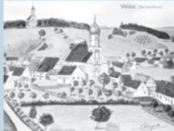
Historische Ansicht von Welden.