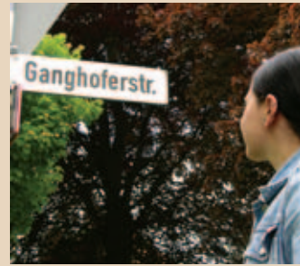
In der Ganghoferstraße in Welden.