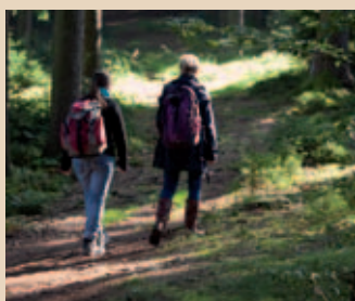
Etliche (Rad-)Wanderrouten führen entlang der Spuren Ludwig Ganghofers.

Der Bestsellerautor Ludwig Ganghofer, Verfasser millionenfach verkaufter Heimatromane und Volksstücke, verbrachte prägende Kindheitsjahre in dem kleinen, idyllisch im Holzwinkel gelegenen Ort Welden. Hügel Landschaft und ausgedehnte Waldgebiete prägen den Holzwinkel, den nördlichen Teil des „Naturparks Augsburg – Westliche Wälder“. Die Gegend und damit auch „Ganghofers Kindheitsidylle“ lässt sich familienfreundlich auf etlichen Rad- und Wanderrouten erkunden.