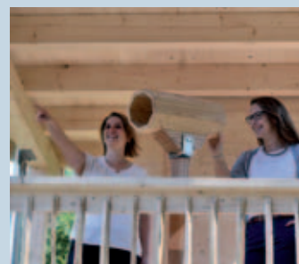
Durch ein „Fern-Seh-Rohr“ sieht der Wald gleich noch viel spannender aus.

5 „Mein Wald“ von oben Auf einem Hochsitz steht ein „Fern-Seh-Rohr“: Entdecke damit den Wald.