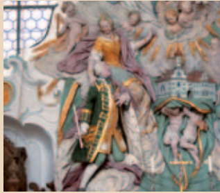
In der Theklakirche: die Darstellung des Stifters und der heiligen Thekla.