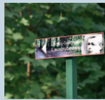
Die Schilder zeigen es: Hier entlang geht es zu Ganghofer und zum Lausbubenweg.

4 „Die Bäume in meinem Wald“ Erkenne den richtigen Baum an den Blattzeichnungen. Infotafeln erzählen von den Fichten und Kiefern, Birken, Buchen und Eichen.