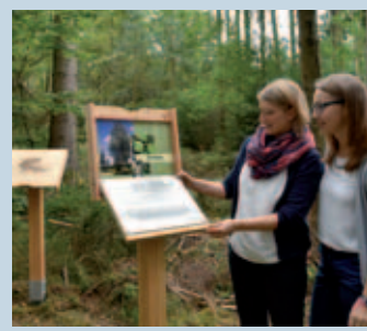
Infotafeln vermitteln Wissenswertes zu den Bäumen im „Ganghofer-Wald“.

5 „Mein Wald“ von oben Auf einem Hochsitz steht ein „Fern-Seh-Rohr“: Entdecke damit den Wald.