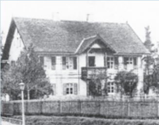
Das Forsthaus Welden (um 1900).