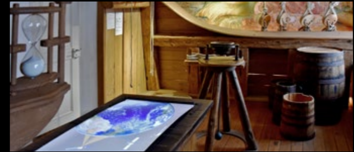
Handelsreise der Welser nach Venezuela