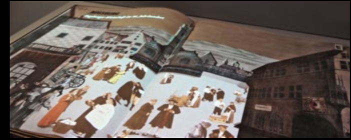
»Das Lebende Buch« zeigt: Die Einführung in das Fugger und Welser Erlebnismuseum