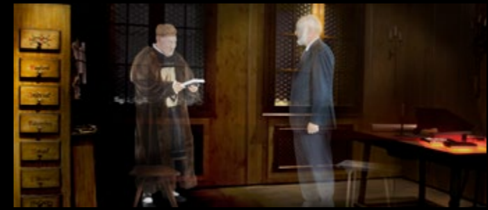
Dialog in der »Goldenen Schreibstube«, der Firmenzentrale von Jakob Fugger