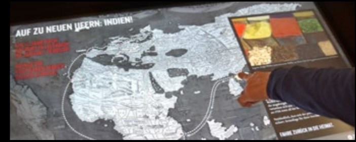
Interaktiver Medientisch zu den Handelsreisen nach Indien