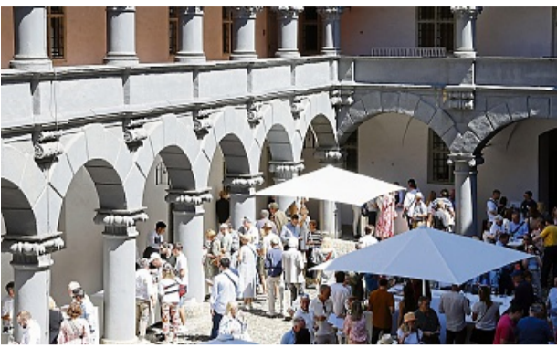
Im Hof der Alten Münze präsentiert Dallmayr seine Neuentdeckungen aus der Welt des Weins. DALLMAYR