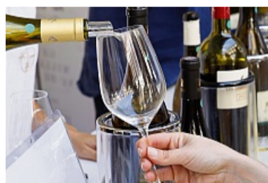
25 Spitzenweingüter präsentieren sich. DALLMAYR

► Adresse: Die Open-Air-Veranstaltung findet im Hof der „Alte Münze“ statt. Hofgraben 4 in 80539 München.