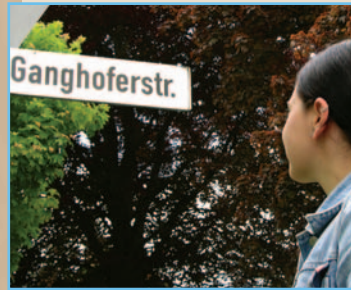
In der Ganghoferstraße in Welden.

Innere der Kirche ist sehr sehenswert (unter anderem mit Fresken des Malers Matthäus Günther).