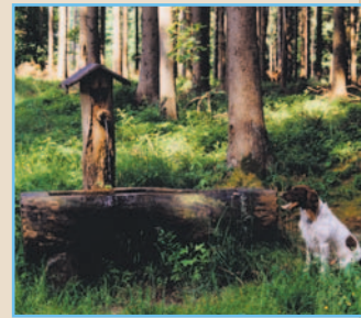
Die Ganghofer-Quelle bei Welden.

Diese 1985 errichtete Hütte ist nach Ludwig Ganghofer benannt. Der gemütliche, jederzeit zugängliche Innenraum lädt zum Verweilen ein. Wandert man rund 400 Meter weiter auf dem Hörgrabenweg und folgt dem ersten links führenden Waldweg leicht bergauf, stößt man auf die August-Ganghofer-Hütte.