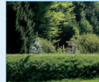
Radwanderer und Inlineskater auf dem Landrat-Dr.-Frey-Radweg zwischen der Stadt Neusäß und Welden im Naturpark Augsburg – Westliche Wälder.

Hinweis für Inlineskater: Die Weldenbahntrasse im Naturpark Augsburg – Westliche Wälder (der so genannte Landrat-Dr.-Frey-Radweg) zwischen Neusäß und Welden ist durchgängig für Inlineskater geeignet.