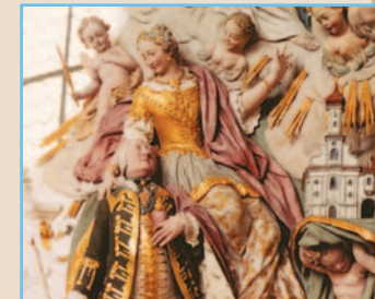
In der Theklakirche: die Darstellung des Stifters und der heiligen Thekla.