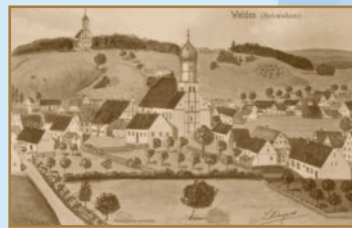
Historische Ansicht von Welden.