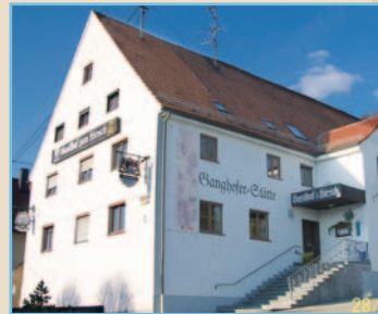
Der Landgasthof Zum Hirsch.

Erst nachdem die Mutter Ludwig Ganghofers aufgrund der schlechten Wohnbedingungen im alten Weldener Forsthaus an Typhus erkrankt war, ließ die Regierung 1865 das neue Forsthaus in der Bahnhofstraße 15 errichten. Das Forstamt Welden wurde 1973 aufgelöst, heute ist in dem Gebäude die evangelische Kirchengemeinde beheimatet.