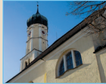
Ludwig Ganghofer musste vom Turm der Weldener Pfarrkirche gerettet werden.

Die Ganghoferstraße ist August Ritter von Ganghofer, Ludwigs Vater, gewidmet, der von 1859 bis 1873 Revierförster in Welden war und sich um den bayerischen Staatsforst hohe Verdienste erwerben sollte. In dieser Straße direkt an der Laugna stand das alte Forsthaus, in dem die Familie Ganghofer bis 1865 lebte.