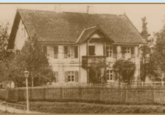
Das Forsthaus Welden (um 1900).

Die Ganghofer-Quelle inmitten eines idyllischen Waldstücks ist ein Ort zum Auftanken, eine Oase der Stille. Am hölzernen Brunnentrog erholen sich die Wanderer – zum Beispiel bei der Tour „Der Ganghofer-Weg“.