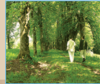
Die Lindenallee zur Theklakirche pflanzte Ludwig Ganghofers Vater.

Die Lindenallee auf dem Theklaberg wurde 1869 von Revierförster August Ganghofer gepflanzt. Ludwig Ganghofers Schwester vermerkte, dass „... die Gemeinde die Pflanzen unent-