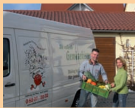
„Die rollende Gemüsebox“ liefert direkt an die Haustür.

Die rollende Gemüsebox – Lieferservice Affinger Straße 23, 86444 Gebenhofen Telefon 0 82 07/20 32 gemueseboxe@t-online.de, www.rollende-gemueseboxe.de Ökokisten Verband