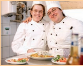
Das Café & Restaurant SOWIESO beschäftigt auch Menschen mit Behinderungen.

Auf der reichhaltigen Speisekarte – auch mit Bio-Komponenten – findet sich u. a. das „Augsburger Menü“. Neben Tee und Kaffee aus fairem Handel bietet der Integrationsbetrieb, der auch Menschen mit Behinderungen beschäftigt, ein Veranstaltungsprogramm, Partyservice und den Rahmen für Betriebs- und Familienfeiern.