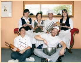
Alles ist „bio“ in Ulis Kaffeehaus – von Brot und Semmeln über die Pralinen bis hin zur Hochzeitstorte.

In Ulis Kaffeehaus gibt es nicht nur Brot, Semmeln, Feingebäck, Pralinen, Eis und Hochzeitstorten in Bio-Qualität. Die Bio-Bäckerei und -Konditorei mit Bioland-Vertragspartnerschaft bietet auch warme Speisen und Getränke und ein breites Diabetikersortiment an. Und für Events können der Caféraum „mit mediterranem Flair“ und Kinderspielecke, der Wintergarten und die Sonnenterrasse angemietet werden.