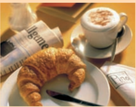
Im Café-Bistro Pino ist das Frühstück täglich bis 17 Uhr möglich – unter anderem mit dem „Augsburger Biofrühstück“.

„Frühstückskultur“ ist erlebbar: Neben dem „Augsburger Biofrühstück“ sind vielfältige Frühstückskreationen täglich bis 17 Uhr im Angebot, außerdem der Mittagstisch „fein und flott“. Snacks und Cocktails tragen abends (Happy Hour) bei „chilliger“ Musik zur entspannenden Atmosphäre bei. Firmen-events und Familienfeiern mit Themenbuffet oder Menü-Auswahl sind buchbar, im Obergeschoss für 20 bis 40 Personen.