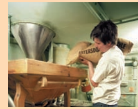
In hauseigenen Steinmühlen der Bäckerei Schubert wird Korn täglich frisch gemahlen.

Seit 1973 produziert Schubert Backwaren aus Bio-Getreide. Nach dem Motto „Gutes Brot, guter Tag“ werden 80 Bio-Vollwertprodukte, 30 Bio-Backwaren aus Weißmehl und Brot aus Natursauerteig hergestellt. Für Allergiker sind weizenfreie Backwaren aus Dinkel oder Roggen und hefefreie, eifreie sowie zuckerfreie Backwaren im Programm. Korn aus der Region wird in der Bäckerei Schubert täglich frisch in hauseigenen Steinmühlen frisch in hauseigenen Steinmühlen gemahlen.