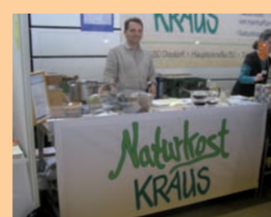
Von Bio-Backwaren bis zur Naturkosmetik reicht das Angebot auf über 80 m 2 .