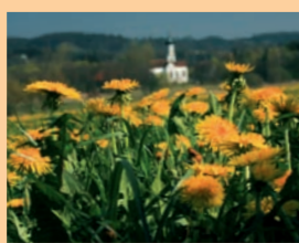
Der „Naturpark Augsburg – Westliche Wälder“ gilt als die „grüne Lunge“ der Großstadt Augsburg.

Klingelingeling... Einmal pro Woche kommt der Gemüsemann: Bio-Kisten mit Obst, Gemüse und weiterer Naturkost in unterschiedlicher (auch individueller) Zusammenstellung und Größe gibt es im Abo. Die „gesunde Frische frei Haus“ wird direkt angeliefert. Alle Produkte kommen aus kontrolliert biologischem und bevorzugt aus regionalem Anbau.