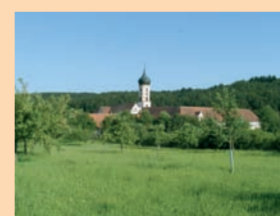
Kloster Oberschönenfeld ist das Zentrum des „Naturparks Augsburg – Westliche Wälder.“

Naturpark Augsburg – Westliche Wälder e. V. Geschäftsstelle: Fuggerstraße 10, 86830 Schwabmünchen Telefon 08 21/3 10 2-22 78 Außenstelle: Naturpark-Haus Oberschönenfeld, 86459 Gessertshausen Telefon 0 82 38/3 00 1-32 www.naturpark-augsburg.de Anmeldung: Telefon 0 82 94/22 77 und 08 21/4 86 70 70 Anmeldung zu speziellen Kräutervandern: Telefon 0 82 04/17 41, 0 82 62/13 49 und 08 21/43 72 45