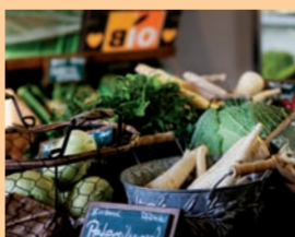
Das vis à vis ist ein Bio-Lebensmittelhandel mit einem Café in Königsbrunn.

Das vis à vis in Königsbrunn bietet Bio-Lebensmittel: Eier, Gemüse, Äpfel und Fleisch direkt vom Erzeuger. Kaffee- und Teespezialitäten, Käse, Wein, Schokoladen und Geschenke ergänzen das Angebot. Im Café wird neben dem „100 % Bio-Frühstück“ und „Bio-Mittagessen“ auch selbst gemachter Kuchen an der Espresso-Bar serviert. Das Café kann auch für Feste und Veranstaltungen angemietet werden.