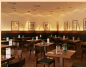
In stillvollem und modernem Ambiente verwöhnt das barrierefreie annaRestaurant.

Das „anna“, ein Café und Restaurant mit leckerer Bio-Küche, lädt im hellen und modernen Ambiente zum entspannten Verweilen ein. Neben Frühstück und Salatbuffet (11.30 bis 15 Uhr), Bio-Kuchen, -Torten und -Getränken bietet das „anna“ einen Catering- und Partyservice sowie ab 18 Uhr Restaurantbetrieb. Der Kaffee und die Bio-Trinkschokolade sind fair gehandelt, das Gemüse stammt von regionalen Lieferanten. Für Kinder bis drei Jahre ist das Pastabuffet gratis.