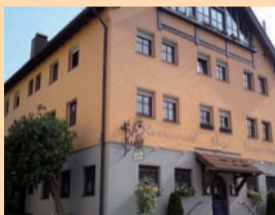
Familiär geführt – das Hotel-Restaurant Bayerischer Wirt.

Das Drei-Sterne-Hotel mit Tagungsräumen wird familiär geführt und bietet im Restaurant neben dem „100 % Bio-Frühstück“ traditionelle Gerichte und gesundheitsbewusste Bio-Küche. Die frischen Lebensmittel haben einen hohen Anteil an Bio-Qualität und stammen aus der Region.