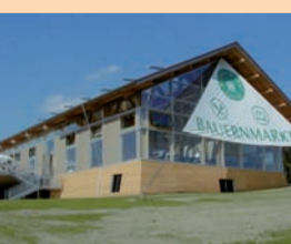
Auf 1200 m 2 verkaufen Bauern aus der Region im Bauernmarkt in Dasing ihre Produkte.

Bauernmarkt Dasing GmbH An der Brandlreiten 6, 86453 Dasing Telefon 0 82 05/9 59 91-0 info@bauernmarkt-dasing.de, www.bauernmarkt-dasing.de Öffnungszeiten: Gastronomie und Handel täglich 8 bis 20 Uhr, Wurst- und Käsetheke Mo bis Fr 8.30 bis 18 Uhr, Sa 8.30 bis 16 Uhr Anfahrt: A 8, Autobahnausfahrt Dasing