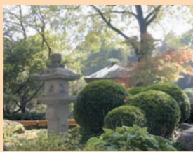
Der Japanische Garten ist ein bekanntes Beispiel der fernöstlichen Gartenkultur.

„Naturnahe Grün-Oase – Natur zum Erleben zu jeder Jahreszeit“ lautet das Prinzip, dem der 10 Hektar große, ganzjährig geöffnete Botanische Garten verpflichtet ist – mit Vielfalt im Freigelände und in der „Pflanzenwelt unter Glas“, wechselnden Ausstellungen rund um das Thema Natur, Lesungen, Gartenpraxis-Seminare sowie Kinder- und Familienaktionen.