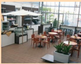
Im Bio-Café-Bistro Göggingen gibt es Bio-Speisen und – bei Bedarf – Rat von der Caritas.

Das Integrationsprojekt steht für „Ganzheitliches Helfen im Einklang mit der Natur“. Im Bio-Café gibt es das „Augsburger Biofrühstück“, Bio-Mittagessen aus regionaler und saisonaler Ernte, Kuchen mit fair gehandeltem Kaffee und Brot aus dem Kloster Oberschönenfeld. Auf Bestellung werden Brotzeiten, Torten, Kuchen und warme Gerichte für Kindergärten und Schulen angeliefert.