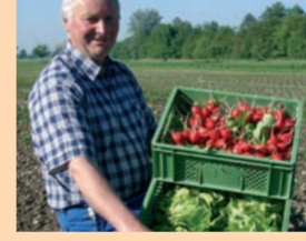
Bioland ist der größte Bio-Anbauverband Deutschlands mit zahlreichen regionalen Bioland-Erzeugern und -Verarbeitern.