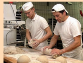
Frisch gemahlenes Getreide aus der Region ist die Grundzutat für Brot, Semmeln und Kuchen.

Beim Neusaßer Bio-Pionier heißt es seit 1970: „Wir backen gern – Sie schmecken es“. Das Getreide kommt vom Bioland-Bauernhof Kreppold in Wilpersberg. Es wird täglich frisch in der eigenen Mühle der Backstube vermahlen. Daraus backen die Vollwertbäcker biologische Backwaren, Brote, Semmeln, Kuchen und süßes Gebäck.