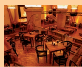
Die regionalen Zutaten sind frisch, das Ambiente prägt die fast 400-jährige Geschichte des Augsburger Rathauses.

Ratskeller Augsburg GmbH Rathausplatz 2, 86150 Augsburg Telefon 08 21/31 98 82 38 info@ratskeller-augsburg.de, www.ratskeller-augsburg.de Öffnungszeiten: So bis Do 11 bis 1 Uhr, Fr und Sa 11 bis 2 Uhr ÖPNV: Haltestelle „Rathausplatz“ (Straßenbahnlinien 1 und 2) Teilnehmer „Umweltfreundliches Gastgewerbe“