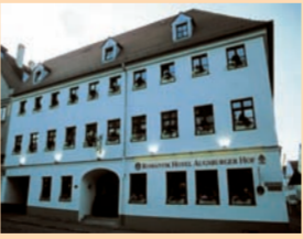
Ein Restaurant verwöhnt im Romantikhof Augsburger Hof.

Das im Landhaus-Ambiente gestaltete Restaurant im feinen Romantikhof Augsburger Hof bietet seinen Gästen das „Augsburger Biofrühstück“ an. Zusätzlich zu den regionalen Gerichten steht an sieben Tagen in der Woche auch ein „Bio-Light-Gericht“ auf der Speisekarte.