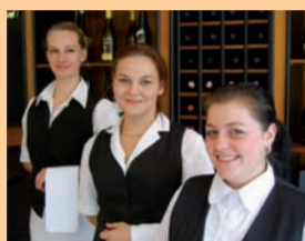
Aufmerksamer Service und vielfältige Angebote werden im emelka großgeschrieben.

Gasthaus emelka Am Backofenwall 3, 86153 Augsburg Telefon 08 21/31 95 5-65 kontakt@emelka.de, www.emelka.de Öffnungszeiten: Di bis So 11 bis 14.30, 18 bis 24 Uhr, Sa 18 bis 24 Uhr ÖPNV: Haltestelle „Senkelbach“ (Straßenbahnlinie 2) Teilnehmer „Umweltfreundliches Gastgewerbe“