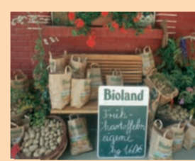
Bioland e.V. ist die Interessenvertretung regionaler Anbieter.