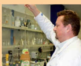
Die Zutaten für Säfte kommen bei der Firma Kunzmann aus der Region.

Kunzmann Weinkellerei-Mineralbrunnen-Fruchtsaft GmbH & Co. KG Taitinger Straße 64, 86453 Dasing Telefon 0 82 05/96 04-0 info@kunzmann-dasing.de, www.kunzmann-dasing.de Öffnungszeiten (Getränkemarkt): Mo bis Fr 8 bis 12 und 13 bis 18 Uhr, Sa 8 bis 12.30 Uhr Anfahrt: A 8, Autobahnausfahrt Dasing