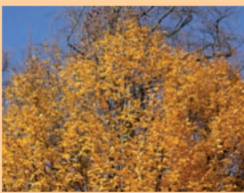
Im Siebentischwald – nahe dem Zoologischen Garten und dem Botanischen Garten – liegt die Waldgaststätte Parkhäusl.

Mitten im Stadtwald serviert das Team der Waldgaststätte Parkhäusl Fleisch vom Bioland-Packhof, außerdem selbst Gemachtes, von Ulis Kaffeehaus gelieferten Bio-Kuchen, Brot von der Bäckerei Schneider, fair gehandelten Bio-Kaffee und Bio-Glühwein von Perger. Romantisch ist der Winterbiertgarten, lustig sind regelmäßige Veranstaltungen für Kinder und praktisch die Möglichkeit, das frisch renovierte Parkhäusl für Feste und Feiern zu mieten.