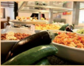
Beim Salat- und Antipasti-Buffet in der „Goldenen Gans“ gilt: entweder Genuss vor Ort oder Genuss zum Mitnehmen.

Der Leitspruch „Bleiben Sie fit, gehen Sie regelmäßig essen“ bezieht Fleisch mit ein, das grundsätzlich von Bioland-Betrieben stammt, internationale vegetarische Küche sowie ein großes Salat- und Vorspeisenbuffet. Special: Johann-Grander-Wasser und Ayurveda-Gerichte, und zwar auch im Innenhof-Biergarten oder per Partyservice.