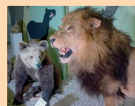
Die Vielfalt der Geologie und Biologie zeigt das Naturmuseum der Stadt Augsburg.

Naturmuseum der Stadt Augsburg Ludwigstraße 2 (Eingang Augusta Arcaden), 86152 Augsburg Telefon 08 21/32 4-67 40 naturmuseum.stadt@augsburg.de, www.naturmuseum.augsburg.de Öffnungszeiten: Di bis So 10 bis 17 Uhr ÖPNV: Haltestelle „Theater/Alter Justizpalast“ (Straßenbahnlinie 4) oder Haltestelle „Stadtwerke“ (Straßenbahnlinie 2)