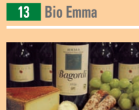
Bio-Produkte aus der Region und aus aller Welt findet man bei „Bio Emma“ auf dem Augsburger Stadtmarkt.

Bio Emma GmbH Fuggerstraße 12 A (Stadtmarkt), 86152 Augsburg Telefon 08 21/15 05 63 Öffnungszeiten: Mo bis Fr 8 bis 18 Uhr, Sa 7 bis 14 Uhr ÖPNV: Haltestelle „Theater/Alter Justizpalast“ (Straßenbahnlinie 4) oder Haltestelle „Königsplatz“ Bioland-Vertragshändler