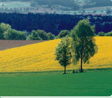
Weiter Blick: Frühsommerliche Landschaft in der Reischenau bei Dinkelscherben.

Karte/Literatur: „Wandern und Radwandern im Naturpark Augsburg – Westliche Wälder, Die Originalkarte im Maßstab 1:55.000“ (ISBN 3-9806733-2-4) sowie der „Wander- und Radwanderführer für den Naturpark Augsburg – Westliche Wälder“ (ISBN 3-9806733-1-6)