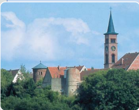
Romantische Station auf dem Jakobus-Pilgerweg durch das „Wittelsbacher Land“: die Stadt Friedberg.