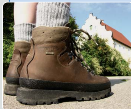
Eine Wanderung um den Burghügel in Oberwittelsbach führt auch zum kleinen Jagdschlösschen in Rapperzell.

Internet: mehr zu diesen und den anderen Sehenswürdigkeiten im „Wittelsbacher Land“ unter www.wittelsbacherland.de