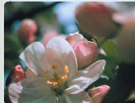
Das blüht dem Wanderer im Frühjahr in Hohenried: blühende Apfelblume in der Streuobstwiese und andere Naturschönheiten.

Internet: Mehr zum Lehrpfad findet man unter www.petersdorf.de .