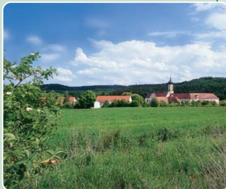
Der kulturelle Mittelpunkt des Naturparks Augsburg: das barocke Kloster Oberschönenfeld.

Karte/Literatur: „Wandern und Radwandern im Naturpark Augsburg – Westliche Wälder, Die Originalkarte im Maßstab 1:55.000“ (ISBN 3-9806733-2-4) sowie der „Wander- und Radwanderführer für den Naturpark Augsburg – Westliche Wälder“ (ISBN 3-9806733-1-6)