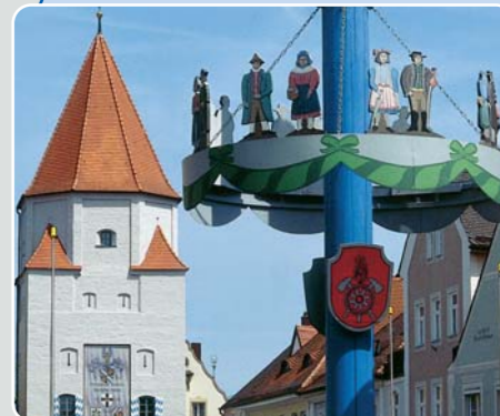
Typisch Altbayern: gotisches Stadttor und der Malbaum im Zentrum der Herzogstadt Aichach, dem Ausgangspunkt einer Tour auf dem Paartal-Wanderweg.