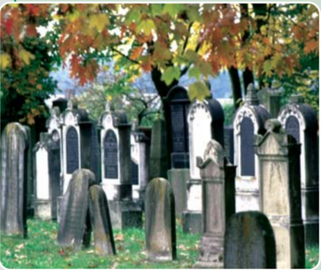
Sehenswert am Wegrand: der alte Friedhof der früheren jüdischen Gemeinde in Fischach.

Route: Augsburg, Jakobskirche - Augsburg, City - Augsburg, Pfersee - Augsburg, Göggingen - Augsburg, Wellenburg - Mader-Quelle - Oberschönenfeld - Weiherhof - Fischach - Wollmetschhofen - Vorderschellenbach - Maria Vesperbild Streckenlänge: 41 km (Augsburg bis Oberschönenfeld 22 km, Oberschönenfeld bis Maria Vesperbild 19 km) – bis Kirchheim sind es weitere 19 km, von Kirchheim ist Babenhausen noch einmal 17 km entfernt Tourencharakter: Es geht auf und ab – vom Wertachtal über das Anhauser Tal und das Schmuttertal bis ins Zusamtal. Wegweisung: durchgehend als Jakobus-Pilgerweg beschildert Sehenswürdigkeiten und Attraktionen: Augsburg (Rathaus, „Kaisermeile“ mit Prachtbrunnen, Fuggerhäusern und Ulrichskirchen, Herz-Jesu-Kirche, Fuggerschloss Wellenburg) - Oberschönenfeld (Kloster, Volkskundemuseum, Naturparkhaus, Staudenhaus) - Fischach (Judenfriedhof) - Maria Vesperbild (Wallfahrtskirche, Schloss Seyfriedsberg) Tipps: 1. Bier und Brotzeit: dafür gibt es hier einige lauschige Biergärten 2. Barock: Kloster Oberschönenfeld und die Kirche Maria Vesperbild 3. Bäume: die Lindenallee bei Wellenburg (ein Naturdenkmal) und der Landschaftspark bei Schloss Seyfriedsberg mit uralten Baumriesen Essen & Trinken: Kloster Oberschönenfeld, Weiherhof, Fischach (hier gleich mehrere Adressen) und bei Maria Vesperbild Prospekt: „Der Jakobus-Pilgerweg in Bayerisch-Schwaben“ Karte: „Wandern und Radwandern im Naturpark Augsburg – Westliche Wälder“, die Karte im Maßstab 1:55.000 (ISBN 3-9806733-2-4)