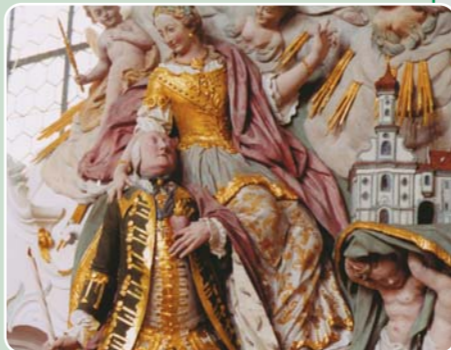
Auf eine lebensgroße Darstellung des Stifters der Theklakirche, Joseph Maria Graf Fugger mit der heiligen Thekla stoßen Besucher des Weldenner Rokokojuwels.

Karte/Literatur: „Wandern und Radwandern im Naturpark Augsburg – Westliche Wälder, Die Originalkarte im Maßstab 1:55.000“ (ISBN 3-9806733-2-4) sowie der „Wander- und Radwanderführer für den Naturpark Augsburg – Westliche Wälder“ (ISBN 3-9806733-1-6)